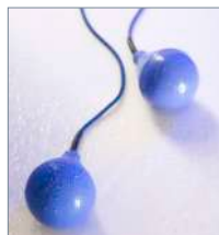
Регуляторы уровня Flygt

Выполняют регулирование пусков и остановов насоса по фактическому уровню воды, и/или активируют устройство сигнализации.