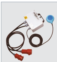
Внешний регулятор уровня Flygt

Автоматически контролирует насос без использования датчиков уровня.