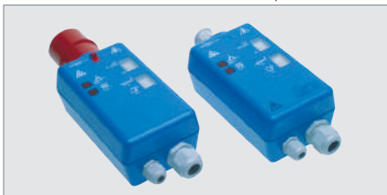
Пускатели насосов Flygt (ручные и автоматические)

Обеспечивают термическую/магнитную защиту от перегрузки, контроль термоконтактов и индикацию чередования фаз.