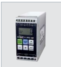
Контроллер насоса Flygt FPC100

Электрические аксессуары Flygt позволяют автоматизировать работу насоса, снизить энергозатраты и степень износа насоса.