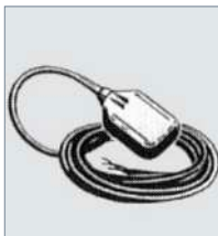
Регулятор уровня, установленный на насосе Flygt

Выполняют регулирование пусков и остановов насоса по фактическому уровню воды, и/или активируют устройство сигнализации.